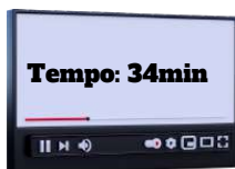
Art. 6º e 7º