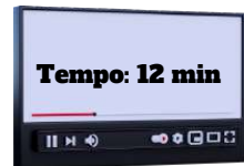
§2º e 3º do Art. 15