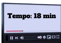
§4º e 5º do art. 15