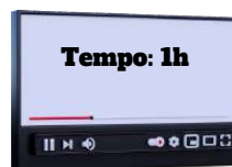
Art. 12 e 13