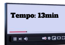
Aula de atualização das hipóteses de perda da nacionalidade