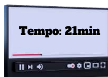
Continuação art. 7º