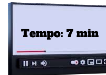
§1º do Art. 15