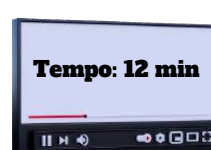
Art. 8 a 10