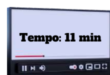
Art. 11 e 12