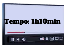
Art. 251 a 263