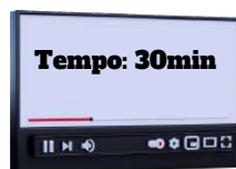
Art. 8º a 11